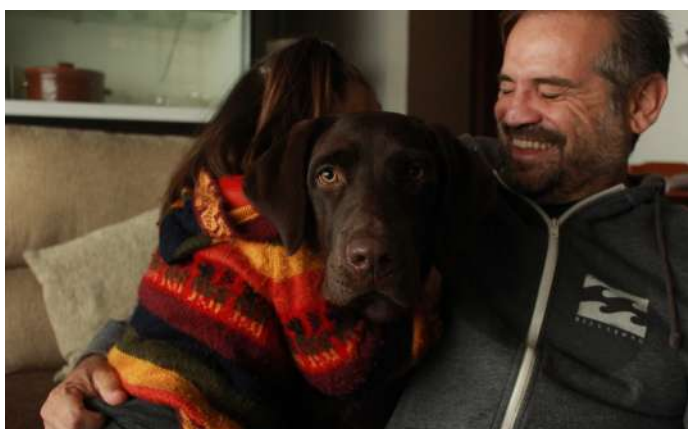
Bienestar emocional para toda la familia

"Yo quiero que mi hijo esté bien, que sea feliz" , esta es otra gran preocupación de madres y padres que cada día, aunque el niño no se haya dormido hasta entrada la madrugada se levantan para enfrentarse a una sociedad que ni cree ni confía en las personas con TEA, a maestras que dicen que sus hijos "no saben", médicos que opinan que no van a llegar a nada y a familiares que no encuentran la manera de ayudar. Reducir éstas crisis supone aliviar el estrés familiar y mejorar las oportunidades de Inclusión Social de toda la familia. Si se reducen las crisis se atreven a salir más y a hacer más actividades que para muchos son cotidianas.