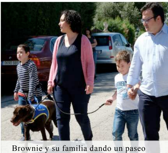
Brownie y su familia dando un paseo

Cuando somos padres nuestras actividades comienzan a girar en torno a los hijos. Parques infantiles, cumpleaños de hijos de amigos y campeonatos deportivos son algunas de las actividades a las que difícilmente nuestras Familias Azules, familias de niños con TEA pueden asistir. Hemos visto en más de un 80% de los casos una experiencia de aislamiento y de falta de apoyos.